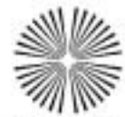
HANNS - LILJE - STIFTUNG

2. Anträge formlos unter Beifügung eines Kosten- und Finanzierungsplanes. Die Förderungen sollen in der Regel einen Bezug zur Ev.-luth. Landeskirche Hannover haben.